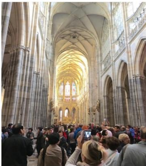
2016年9月：捷克布拉格聖維特教堂