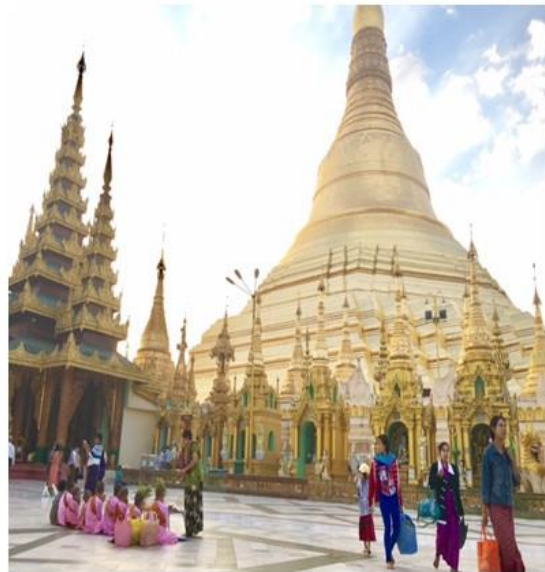
2017年2月：緬甸仰光大金塔