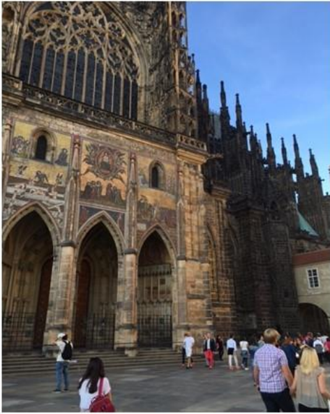
2016年9月：布拉格聖維特教堂