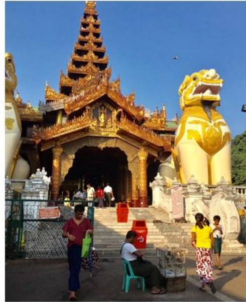
2017年2月：緬甸仰光大金塔