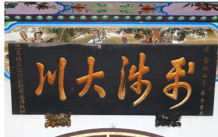
馬公市嵵裡里水仙宮 「利涉大川」匾額