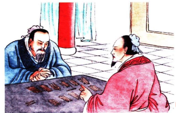
古人以蓍草來占卜。

【譯文】《易經》中包含有聖人之道的四個方面：聖人透過言論而施政教，則看重《易》的爻卦之辭；聖人有所行動作為時，就師法《易》的陰陽變化；聖人在指導製作器物時，就效法《易》卦爻之象(如弓矢、杵臼等)；聖人用來占問決疑時，則崇尚《易》的占筮之理。