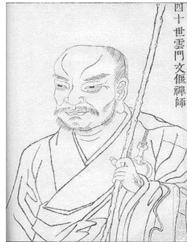
四十世雲門文偃禪師