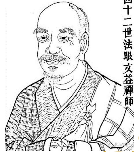
四十二世法眼文益禪師