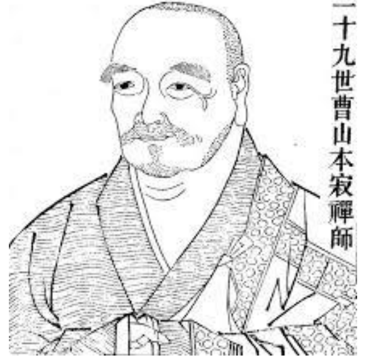
三十九世曹山本寂禪師