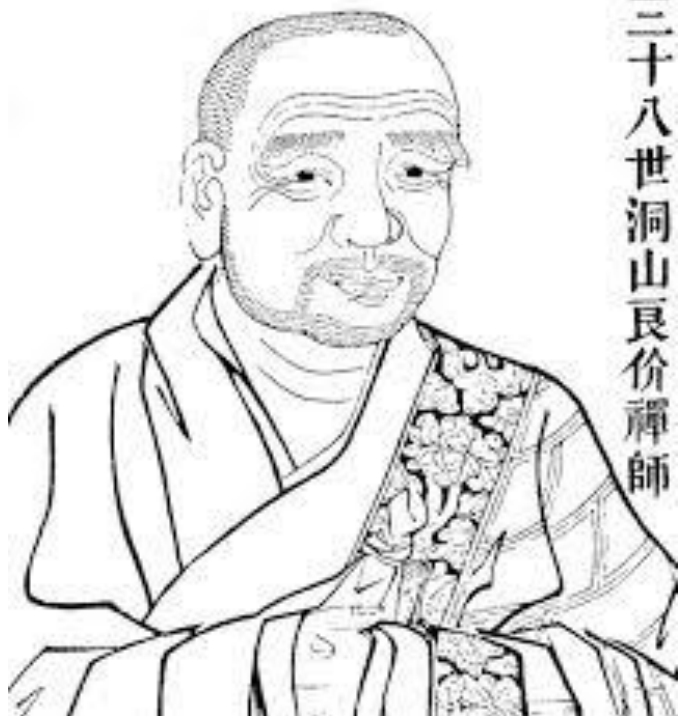
三十八世洞山良价禪師