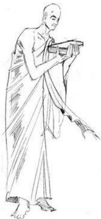
優波離尊者（持律第一）