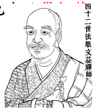
四十二世法眼文益禪師