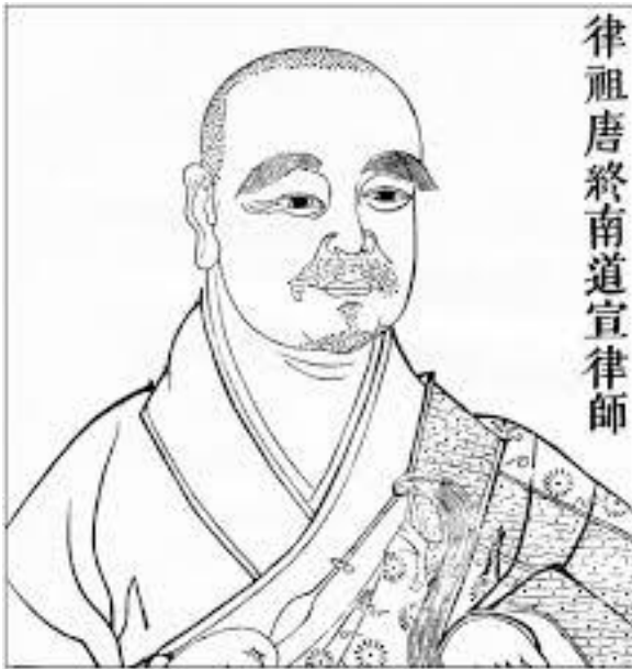
律祖唐終南道宣律師