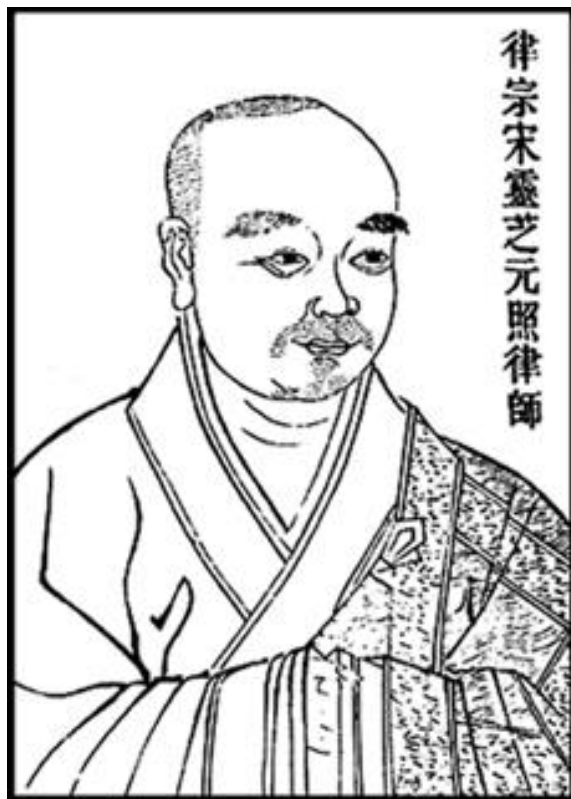
律宗宋靈芝元照律師