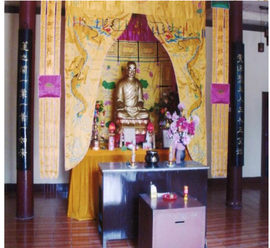
東林寺慧遠大師(中國淨宗初祖)紀念堂