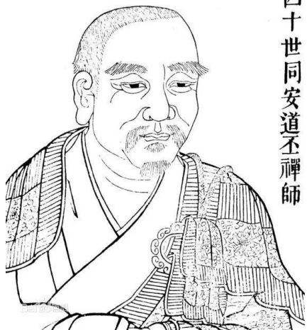
四十世同安道丕禪師