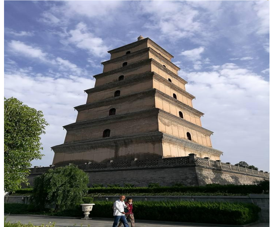
大慈恩寺院內建有大雁塔（保存佛經佛像）（ 瘞雁建塔的故事 ）