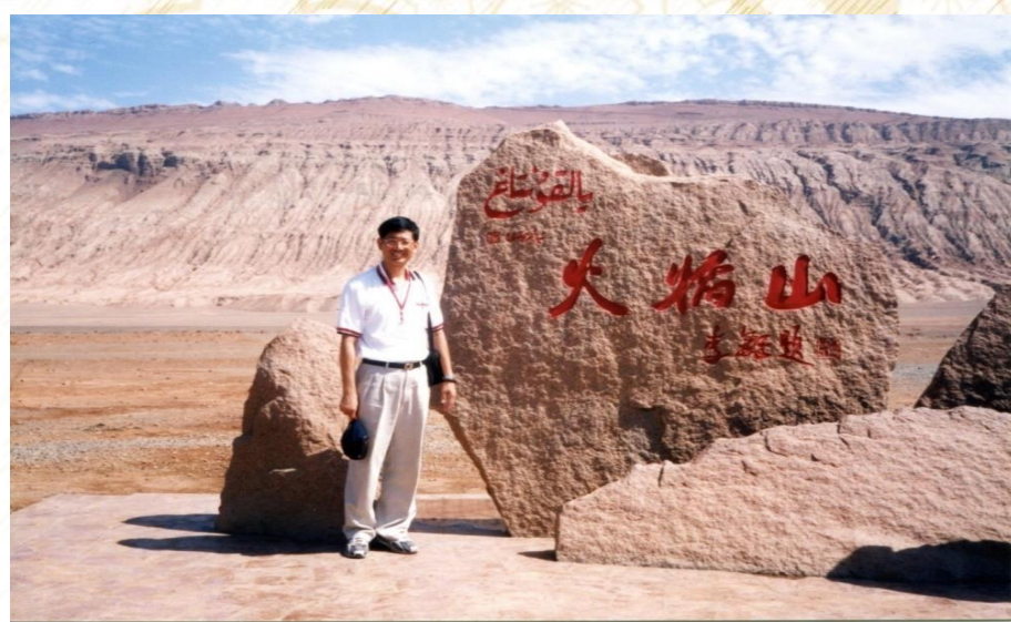
新疆吐魯番盆地火燄山

【引申】人來世間也是「服刑」的一「酬業而來」(「愛不重不生娑婆」；《無量壽經》云：「取相分別，情執深重，求出輪迴，終不能得」)