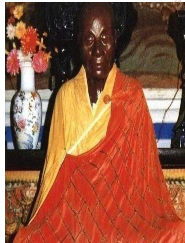
六祖惠能大師(惠者，以法惠施眾生；能者，能作佛事)，我國歷史上出現的第一尊肉身菩薩