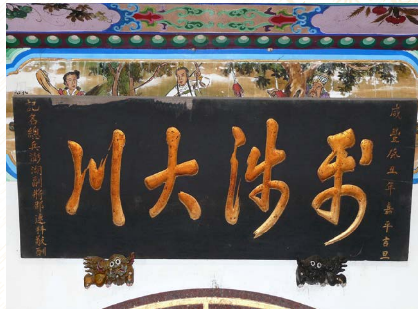
馬公市嵵裡里水仙宮 「利涉大川」匾額