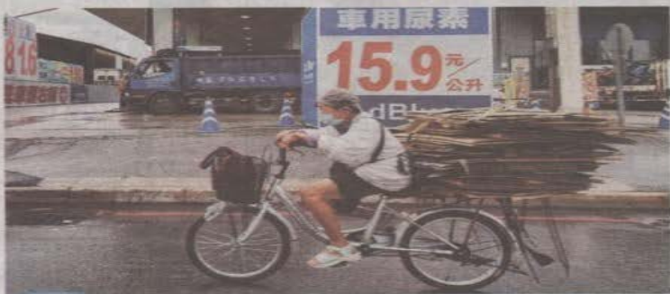
畫中有話 賺的追不上漲的

一名老人踩著腳踏車，準備載回收物去換錢。主計總處上月公布，台灣勞工平均勞動報酬比去年增加九點二萬元，但民衆無感。今年代表字「漲」，民衆心有戚戚焉。在這個萬物皆漲、薪水不漲的年代，民衆賺的追不上漲的，包含物價、房價。政府要做的是苦民所苦，而不是公布無感的數據。圖與文／葉信策