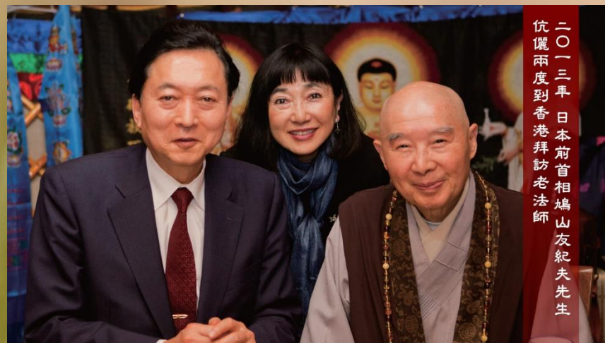
二〇一三年日本前首相鳩山友紀夫先生 伉儷兩度到香港拜訪老法師