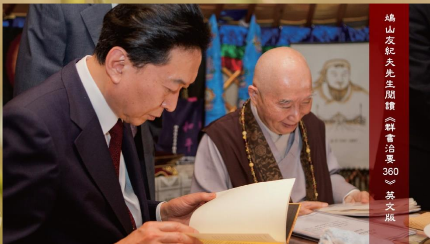
鳩山友紀夫先生閱讀《群書治要360》英文版