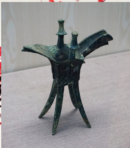
（左圖）西周青銅方爵

藝得先有仁，依靠仁而有藝，沒有一種藝不是仁的發展延伸，例如古代的藝術，都含有規諫的意義，喝酒的觚（音孤）盛二升，按規定只勸二升就該止了，若過二升則是「觚不觚」，要觚何用？這是暗喻。又如爵上有二柱為斝（ㄐㄧㄚˋ），似乎很礙事，那叫「止飲」，喝酒不許乾杯。從前鼎上鑄饗饗，饗饗是堯舜時愛好吃的四凶，鼎是盛菜的器皿，要有所警戒。這些藝都有用意，使人往道上走。