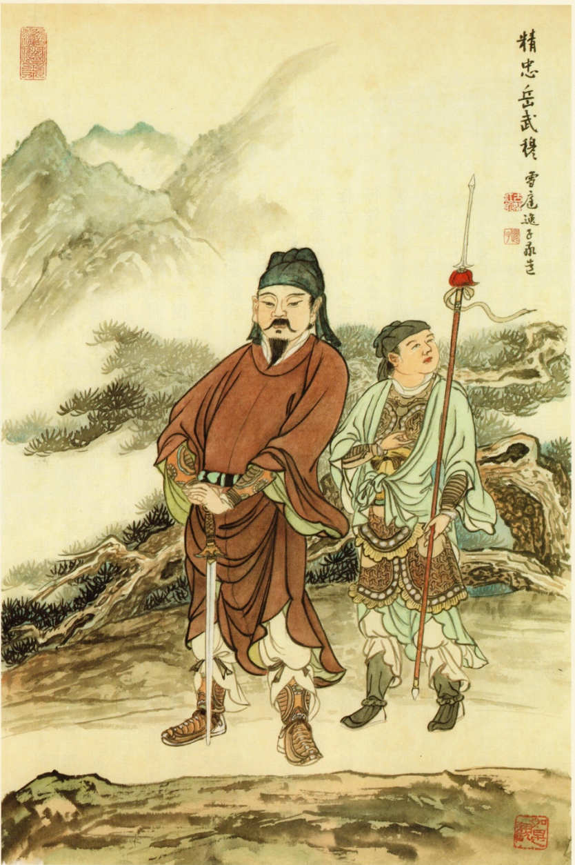
精忠岳武穆 雲尾逸子承誌

文武雙全的岳飛，詩詞作品氣勢磅礴，有著強烈的感染力，且處處體現其思念中原、不忘重任的憂民心懷。清人陳廷焯言：「何等氣概，何等志向！千載下讀之，凜凜有生氣焉。」如世人耳熟能詳的〈滿江紅·怒髮衝冠〉：「怒髮衝冠，憑欄處、瀟瀟雨歇。抬望眼，仰天長嘯，壯懷激烈。三十功名塵與土，八千里路雲和月。莫等閒、白了少年頭，空悲切！靖康恥，猶未雪。臣子恨，何時滅！駕長車，踏破賀蘭山缺。壯志飢餐胡虜肉，笑談渴飲匈奴血。待從頭、收拾舊山河，朝天闕。」將一位忠臣義士和憂國憂民的英雄形象生動地描繪，宛若眼前。還有〈滿江紅·登黃鶴樓有感〉、〈寶刀歌·贈吳將軍南行〉、〈送紫岩張先生北伐〉、〈駐軍盆珠〉等，讀之猶有正氣滌蕩胸臆。他留存給後世《岳武穆遺文》，後人將其著作編成《岳忠武王文集》。岳飛不僅能詩善詞，書法更獨樹一幟，以行、草為主，傳世書跡有《書謝眺詩》、《前後出師表》、《還我河山》等，展現出不同一般的豪氣。