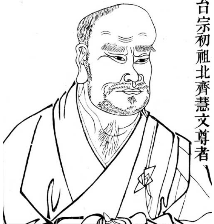
天台初祖北齊慧文尊者